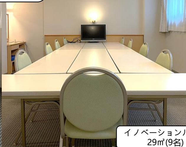
イノベーションルーム 29㎡(9名)