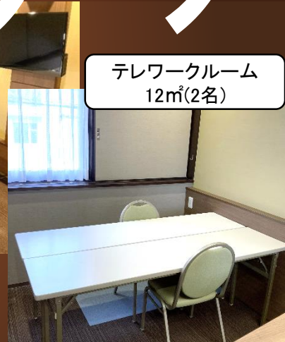
テレワークルーム 12㎡(2名)